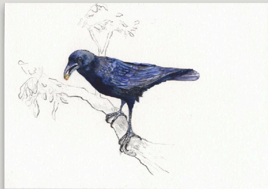
Estudos sobre a terra: inventário de fauna e flora Gralha-Preta, 2016. Aquarela e acrílico sobre papel 30 x 21 cm