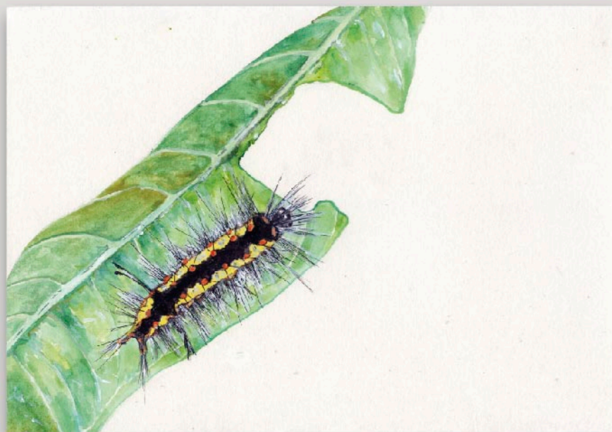
Estudos sobre a terra: inventário de fauna e flora Lagarta da Borboleta-Esmeralda, 2016. Aquarela e acrílico sobre papel 30 x 21 cm