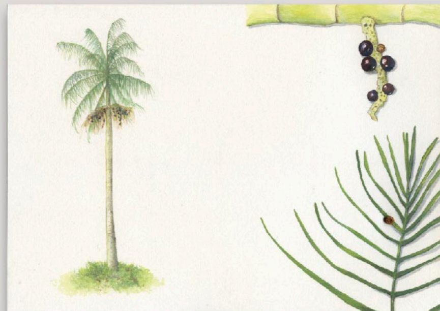
Estudos sobre a terra: inventário de fauna e flora Palmito-Juçara, 2016. Aquarela e acrílico sobre papel, além de colagem de joaninha coletada sobre a imagem 30 x 21 cm